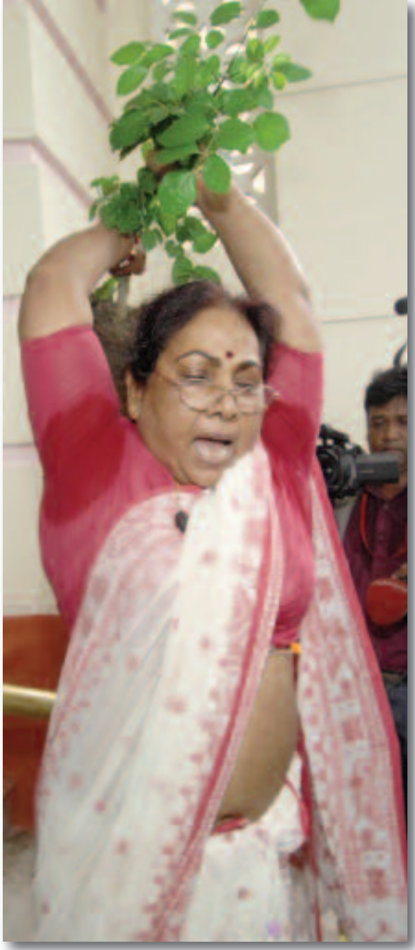
बिहार विधानसभा मे पेश आ विषय जाहि तरह से होगा केलथि । ओहि स कनोट क स सिखल गेल धरना मे बिहार क विधायक उत्तरप्रदेशक मारपीट क कांकेटल देखबाक मौका भेलस । राति भरि सदन मे धरना देलाथि । बीच राति मे नारेबाजी केलथि । मुदा एकटा गप नीचे रहल जे भोजन कोनो पांच सितारा टोटल स नहि आयल । महामहिम सब विधानसभाक कैंटिन मे बनल भोजन केलथि । एहि संबध मे विधानसभा अध्यक्षक कबज अछि जे धरना देल जा रहल अछि स त बुझबा मे आवल मुदा किया से पता नहि ।