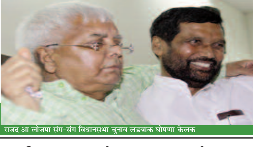
राजद आ लोजपा संग-संग विधानसभा चुनाव लड़बाक घोषणा केलक